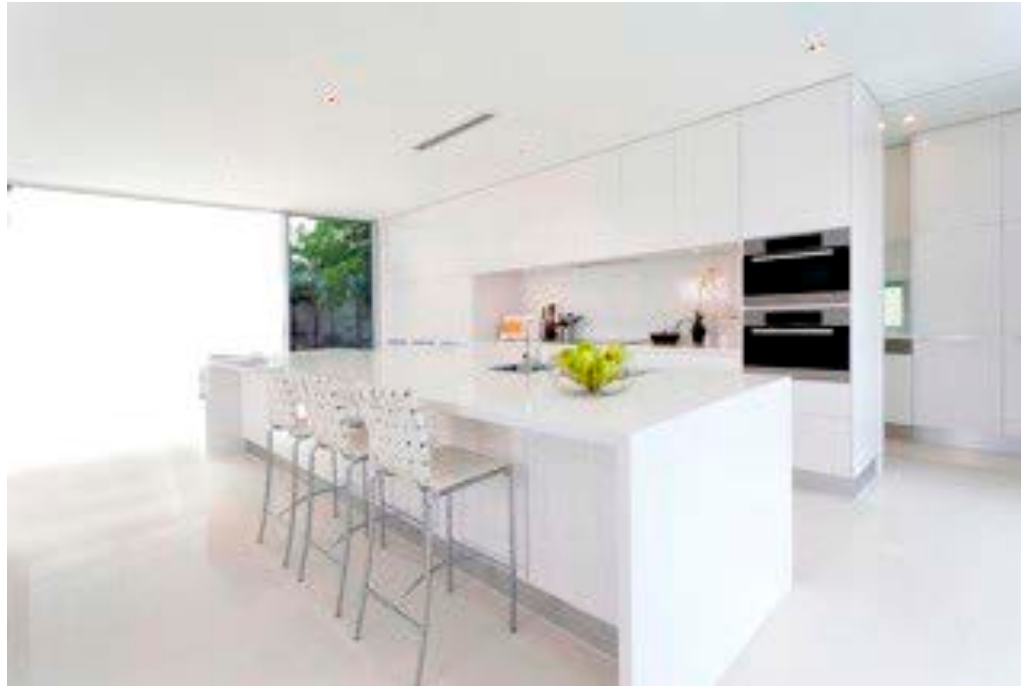
Cocina en zona de piscina Kitchen in pool area